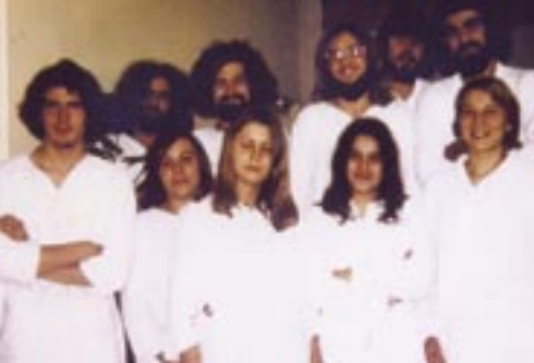
◀ Quelques membres du mouvement hippie avec pour slogan: «Faites l'amour pas la guerre»