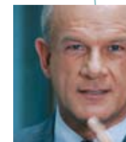
Peter Hahne , né en 1952 à Minden (Westphalie) vit à Berlin. Modérateur à la Z. D. F., la deuxième chaîne allemande, auteur de best-sellers, son livre «Schluss mit lustig» (« Fini la rigolade ») est le best-seller 2005 choisi par « der Spiegel », vendu à 800 000 exemplaires. Editorialiste de «Bild am Sonntag» (« Image dominicale »).

E n voyant cette photo-là je pense immédiatement à mon pasteur de paroisse d'autrefois. Comme nul autre, il rayonnait la vie et la foi, car il était authentique. Dans notre petite paroisse de village il veillait à faire un travail d'éveil auprès des enfants et des jeunes, et finalement plus de trente pasteurs, diacres, missionnaires en sont issus. Il ne se laissait pas entraîner par les idées contemporaines, mais laissait la primauté au Saint Esprit. Il a posé dans mon cœur la chose la plus importante qui soit : la valeur éternelle de l'Évangile. Ce pasteur qui n'a pas scandé de slogans a laissé des traces de son passage. Et dans une époque de folie des grandeurs il a montré la signification et les effets de la fidélité dans les plus petites choses. N'est-ce pas là un exemple ?